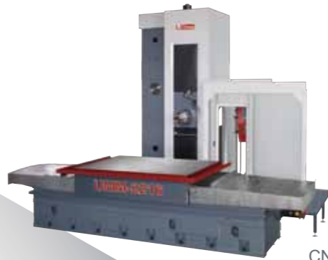
CNC臥式強力銑床 UMM 系列