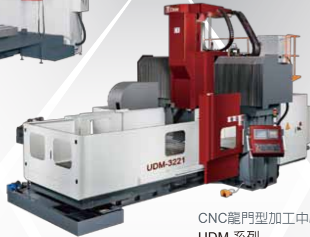
CNC龍門型加工中心機 UDM 系列