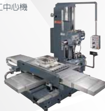
傳統臥式搪銑床 UBM 系列