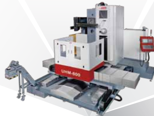
CNC臥式加工中心機 UHM 系列