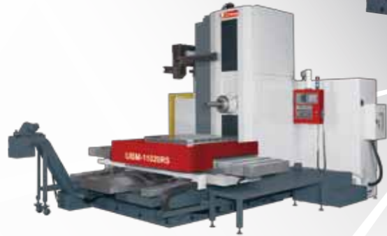
CNC臥式搪銑床 (定柱式) UBM-RS 系列